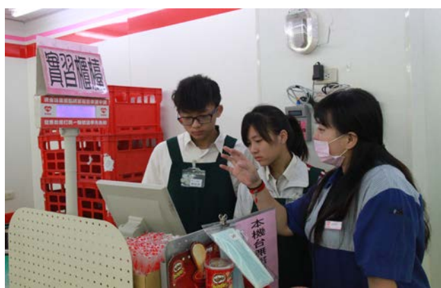
店長指導 POS 系統操作