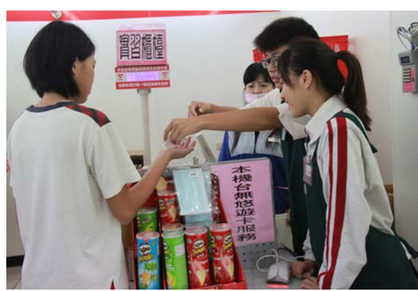
實習學生親自演練