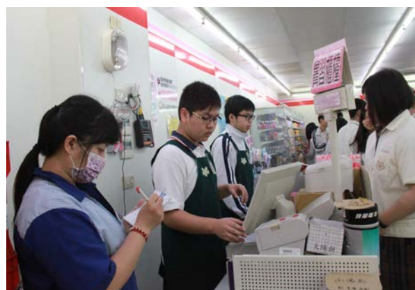
POS 系統操作實務操作