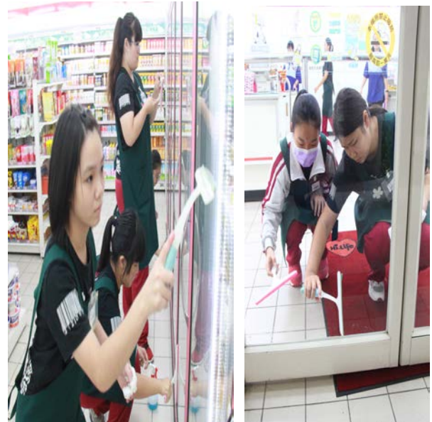
學習擦玻璃的技巧