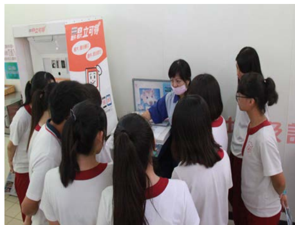
店長說明工作項目