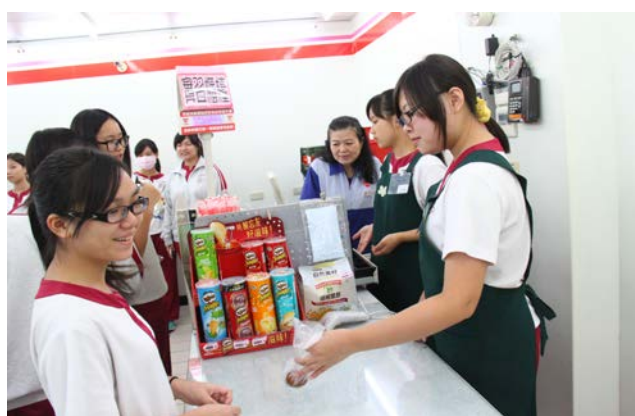
POS 系統操作實務操作