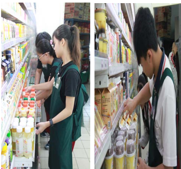
拉牌面，檢查商品期限