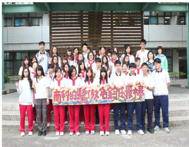
104. 11. 09 技藝競賽集氣授旗