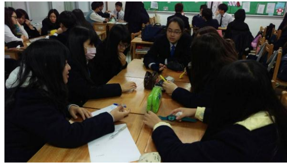
商一仁分組討論情形